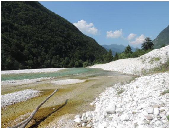
Slika 5 Dolina reke Soče