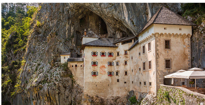
Slika 3 Predjamski grad

Brezplačna aktivnost, organizirana astronomska vodenja pa običajno stanejo približno 15–25 €.