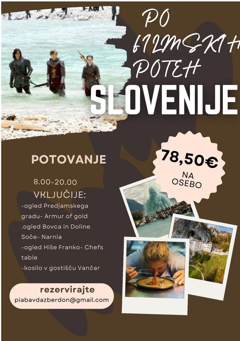
Slika 1 Letak